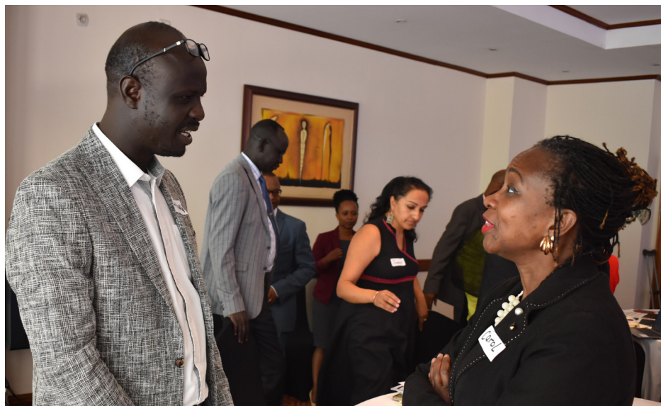
Membres ECSACOG-FIGO du Sud-Soudan et du Kenya lors de la réunion de la communauté de pratique, octobre 2022, Rwanda

Nos communautés de pratique permettent aux individus d'apprendre ce qui fonctionne en participant à une tâche, en s'immergeant progressivement dans le travail et en assumant une plus grande responsabilité à l'égard de ses objectifs.