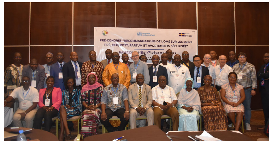
Membres de la communauté de pratique SAGO-FIGO, décembre 2022, Mali

Les priorités actuelles comprennent la création et le renforcement de stratégies de plaidoyer adaptées au contexte de chaque pays, que les membres de la communauté de pratique peuvent mettre en œuvre pour renforcer le plaidoyer pour l'avortement sécurisé dans la région, ainsi que le développement de nouvelles opportunités d'apprentissage direct entre pairs et de mentorat au sein de la région.