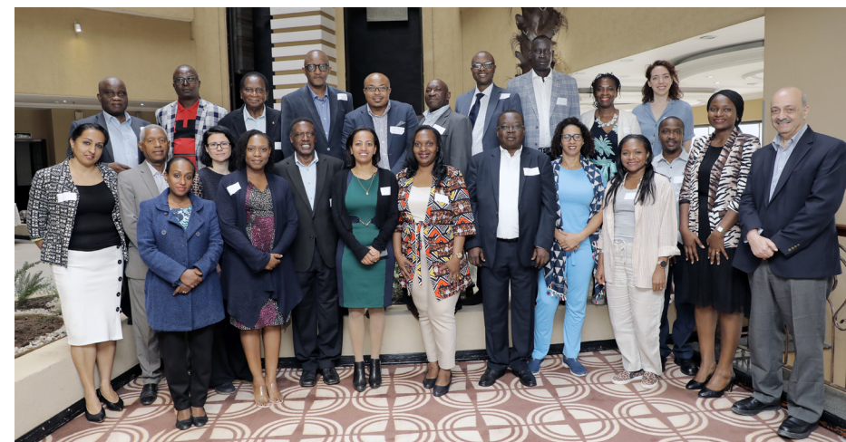
Réunion de la CdP ECSACOG-FIGO, Éthiopie, mars 2023