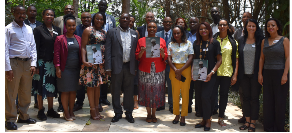
Communauté de Pratique de ECSACOG-FIGO, Octobre 2022, Rwanda