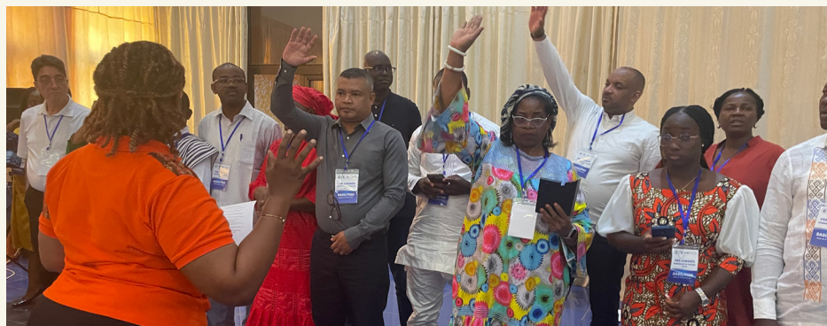
Communauté de Pratique SAGO-FIGO, Juin 2023, Burkina-Faso

Guadalupe Marengo, responsable du programme mondial sur les défenseurs des droits humains, Amnesty International